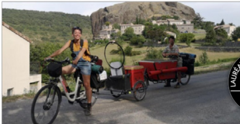
Après la représentation, la caravane a repris la route vers de nouveaux horizons.

Les qualités artistiques de ces itinérants du spectacle n'ont pas échappé aux instances en charge de la culture, à