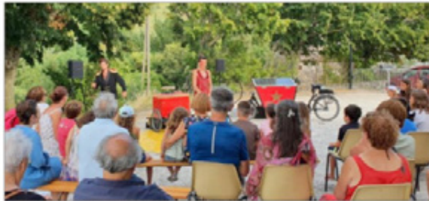
Les artistes devant leur public ravi, vendredi 23 juillet.

La soirée, offerte par les responsables du centre communal d'action sociale, s'est poursuivie par des échanges chaleureux autour du verre de l'amitié.